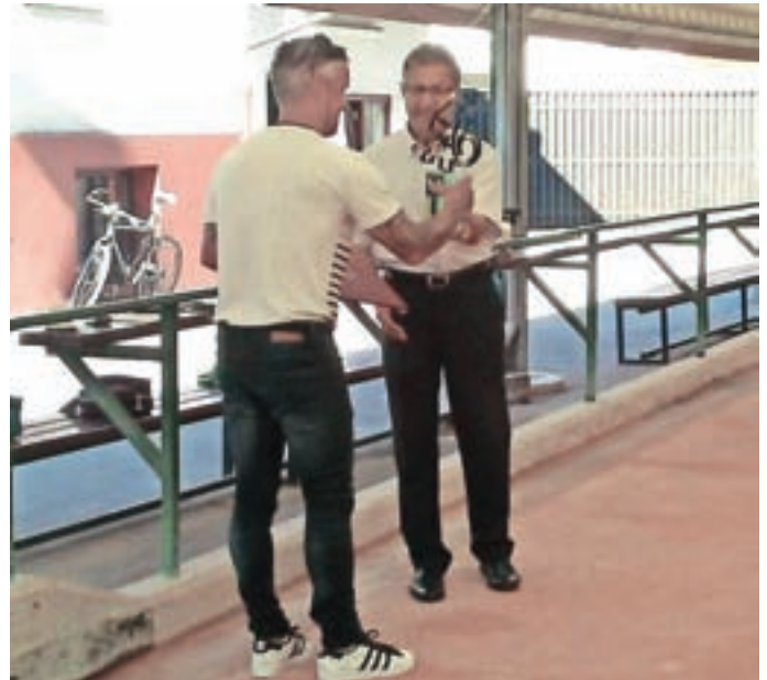
Ob podelitvi županovega priznanja BŠD Žiri

Ekipe BŠD Žiri, navaja župan, vsa leta dosegajo odlične rezultate v različnih disciplinah. Prirejajo vrsto klubskih tekmovanj, v zadnjih letih pa sodelujejo tudi z Osnovno šolo Žiri pri organizaciji interesnih dejavnosti. "Dobra organizacija društva je eden od razlogov, da jim je bila skupaj z Balinarskim klubom Kolektor Idrija zaupana organizacija državnega in evropskega prvenstva ženskih ekip." Županovo