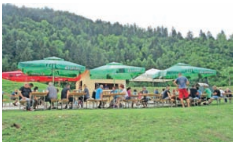
Letos so poskrbeli tudi za gostinsko ponudbo.