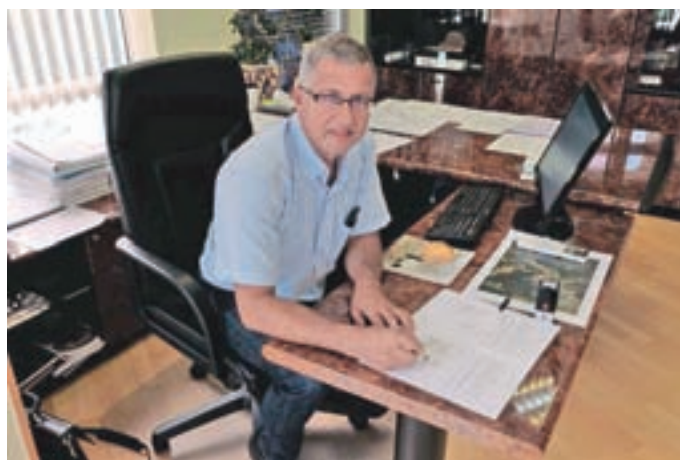
S podpisa donacijske pogodbe z NKBM

Projekt je z donacijo v preteklosti že podprla Zavarovalnica Triglav, pred časom pa so pridobili še enega sponzorja, to je