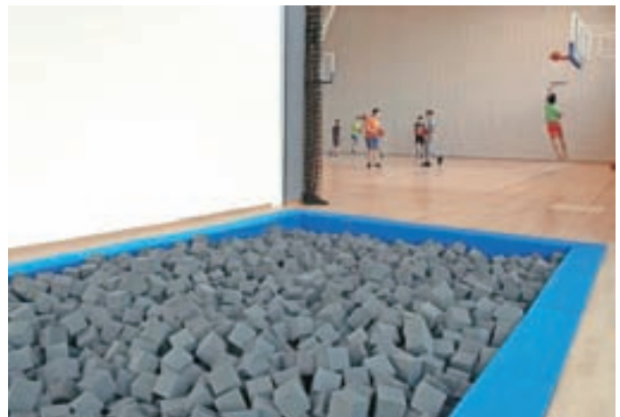
Posebnost v dvorani je jama s penami za izvajanje akrobacij.

"Dvorana je ta čas zasedena več kot 80-odstotno. Zanimanje za najem je res veliko, večina zunanjih uporabnikov naj bi dejavnosti začela izvajati v oktobru," je razložil Mlinar. Dogovori potekajo tudi s potencialnim najemnikom prostorov za fitness. "Želi si čim prej začeti, če bodo razmere dopuščale, naj bi fitness