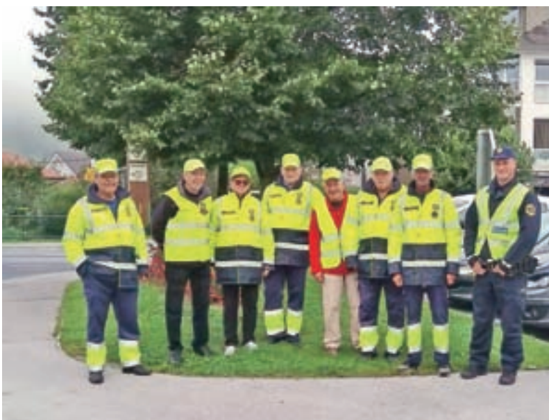
Ob začetku šolskega leta so v prvih dneh pouka skrbeli za varnost šolarjev na šolskih poteh.

Celotno besedilo javnega razpisa je objavljeno na spletni strani www.ziri.si .