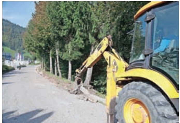
Gradnja pločnikov v industrijski coni

Občina Žiri ima v prostorskih načrtih opredeljeno poslovno cono P1, kjer so zgoščeni poslovni objekti večjih gospodarskih družb. Cona se v zadnjih letih vztrajno širi, saj prihajajo novi investitorji, obstoječe družbe pa širijo svoje dejavnosti in gradijo nove objekte. Občina Žiri je v letu 2009 dokončala projekt komunalnega opremljanja cone, sofinanciran iz evropskih sredstev, vendar le v tedanjem obsegu uporabljenega območja. Zaradi novih objektov sta nujni dograditev cestnega omrežja v coni in ureditev druge komunalne infrastrukture. Projekt gradnje povezovalne ceste v industrijski coni na trasi Ika–Etiketa–Norica zajema gradnjo dveh odsekov ceste in pripadajoče komunalne infrastrukture, in sicer od križišča pri Poclainu do Etikete v dolžini 350 metrov in od Etikete do