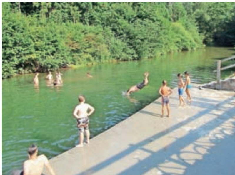
Na kopališču Pustotnik je bilo poleti zelo živahno.