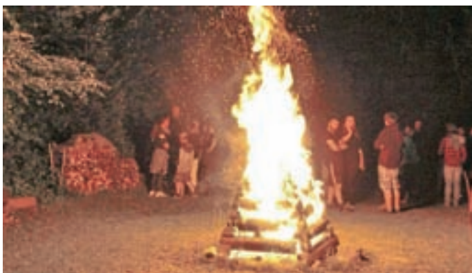
Številne legende govorijo o moči ognja na kresno noč.