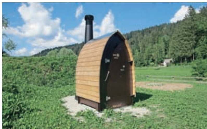
Novost so lesene sanitarije.

Pustotnik poleg ohladitve v Sori ponuja še številne druge možnosti za sprostitev in rekreacijo. Med drugim je mogoče brezplačno najeti igrišče za odbojko, ki je tudi osvetljeno.