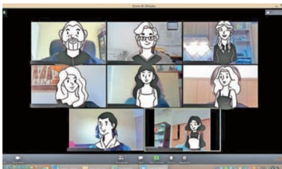
V času pandemije so na Ljudski univerzi Škofja Loka potekala e-izobraževanja.