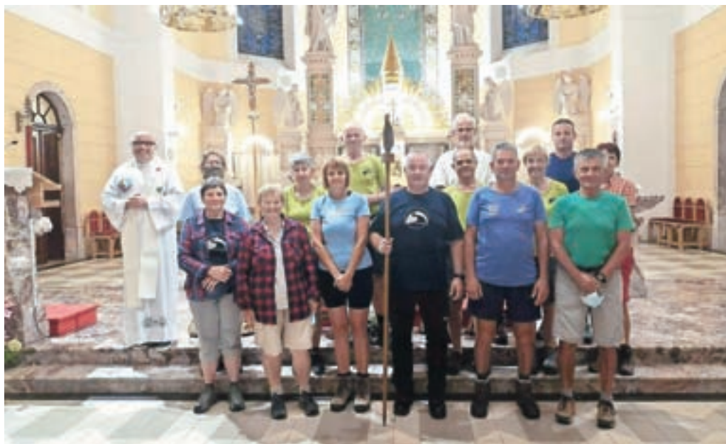
Božjepotniki na cilju v romarskem središču Tri fare