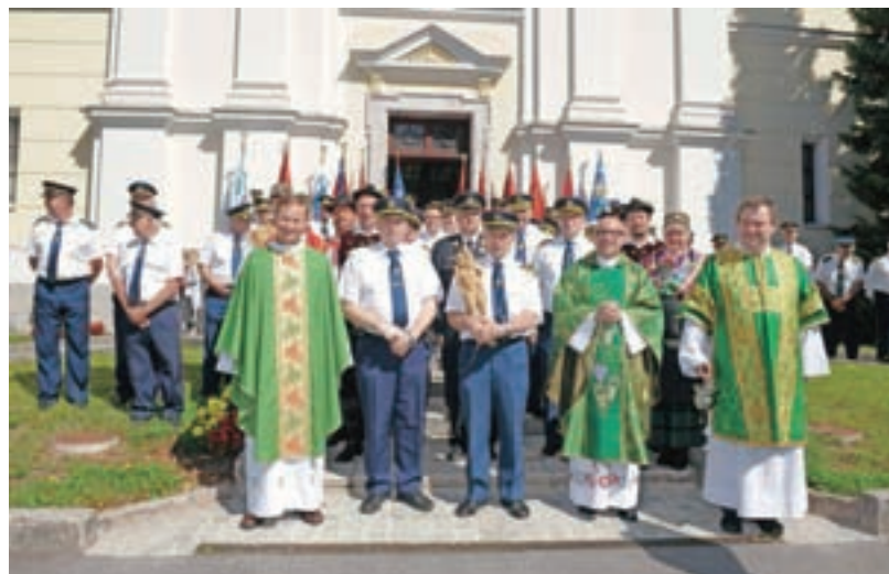
Člani ZŠAM Žiri so sredi julija v cerkvi sv. Martina v Žireh praznovali god svojega zavetnika sv. Krištofa.

Člani ZŠAM pa so kot vsako leto ob začetku šolskega leta v prvih dneh pouka skrbeli za varnost šolarjev na šolskih poteh. Letos je to nalogo opravljalo 24 njihovih članov v Žireh, Gorenji vasi, Železnikih in na Jesenicah. "Skupaj so opravili 384 prostovoljnih ur," je razložil Dolenc. V Žireh so nad varnostjo šolarjev v prometu bdeli na krožišču pri Petrolu, pred vsemi tremi vhodi v poslopje šole in v središču Žirov, pri čemer so jim v prvih dveh dneh priskočili na pomoč tudi policisti in občinski redarji. "Te točke smo namreč skupaj s Svetom za preventivo in vzgojo v cestnem prometu ocenili kot najbolj problematične," je razložil Dolenc in dodal, da so imeli veliko dela predvsem z opozarjanjem staršev, naj svoja vozila parkirajo na označenih parkiriščih in otroke peš pospremijo do šole, namesto da jih zapeljejo čisto do vhoda v šolo. V prihodnje načrtujejo še predavanja za četrtošolce, kako napisati pismo starim staršem, v katerem jim bodo svetovali, kako