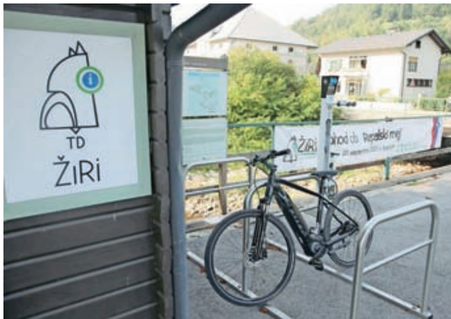
Pri turistično-informacijski točki v Žireh so postavili servisni stebriček s polnilnico in stojali za kolesa. / Foto: Gorazd Kavčič

Začelo se je s Kolesarskim zajtrkom in popravilom koles za občane. Občanom je bil namreč na voljo serviser, ki je poskrbel za manjša popravila koles in obenem svetoval, kako jih čim boljje vzdrževati tudi v prihodnje. Prvih trideset obiskovalcev je prejelo brezplačni zavojček prve pomoči in kolesarski zvonček. Sočasno se je odvijalo še kolesarjenje za otroke s šolo varne vožnje in kolesarjenje za odrasle. Za otroke so pripravili spretnostni poligon, ki je sestavni del kolesarskega izpita. Predstavili so jim teoretične osnove pravil vedenja na cesti, cestnoprometne predpise in prometne znake. Odrasli pa so lahko prisluhnili predavanju na temo varne vožnje s kolesom, vzdrževanja tehnične brezhibnosti kolesa ter priprave kolesa na zimo in novo kolesarsko sezono. Po teoretičnem delu so se lahko preizkusili še v vožnji na poligonu z lastnimi ali električnimi kolesi izbranega ponudnika.