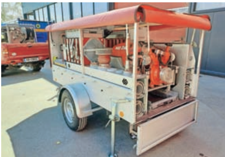
Nova prikolica za prevoz motorne brizgalne z novejšo in bolj zmogljivo brizgalno s pripadajočo opremo in orodjem za gašenje požarov in prečrpavanje vode

Z novo pridobitvijo bomo hitreje in varneje prispeli na intervencijo, kjer bomo zaradi boljše in zanesljivejše opreme še učinkovitejši.