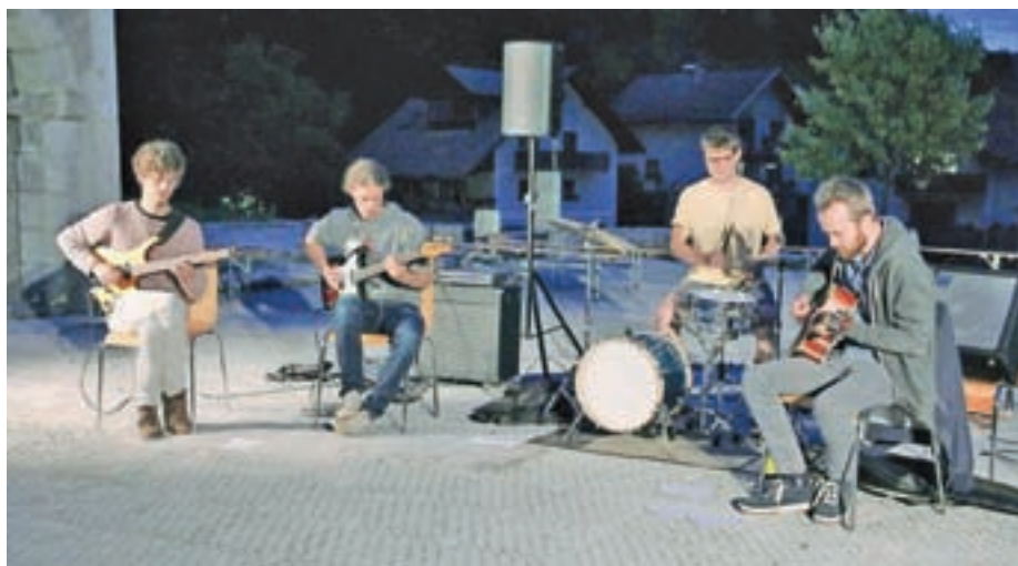
Mladi žirovski glasbeniki so poskrbeli za prijeten zaključek večera.