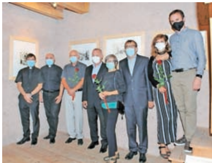
Odprtje razstave ob štiridesetletnici Žirovskega občasnika