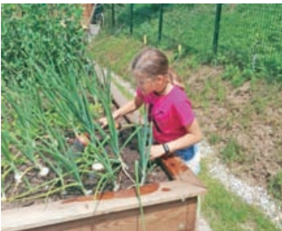
Zarja pri delu na šolskem vrtu

Če vas bo zamikalo, da bi si tudi vi, cenjeni krajan, ogledali našo pridobitev, se odpravite na popoldanski sprehod v Mršak. Že kmalu za zadnjimi hišami, ko se začne cesta dvigati proti Goropekam, se od nje odcepi kolovozna pot navzdol proti šolskemu vrtu. Ta se vije naprej med obema parcelama pod vznožjem Goropeške vzpetine. Ne bo vam žal. Mogoče boste dobili prav tu tudi vi navdih za kakšno spremembo na svojem domačem vrtu. Pa veliko užitkov pri delu na katerem koli vrtu želim.