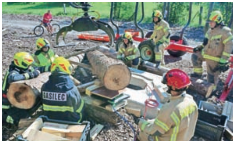
Reševanje ukleščene osebe izpod hlodovine s pomočjo pnevmatskih dvizhnih blazin / Foto: Borut Šorli

Hvala vsem sodelujočim ter podjetjem in posameznikom, ki ste s svojim prispevkom pripomogli k organizaciji dogodka.