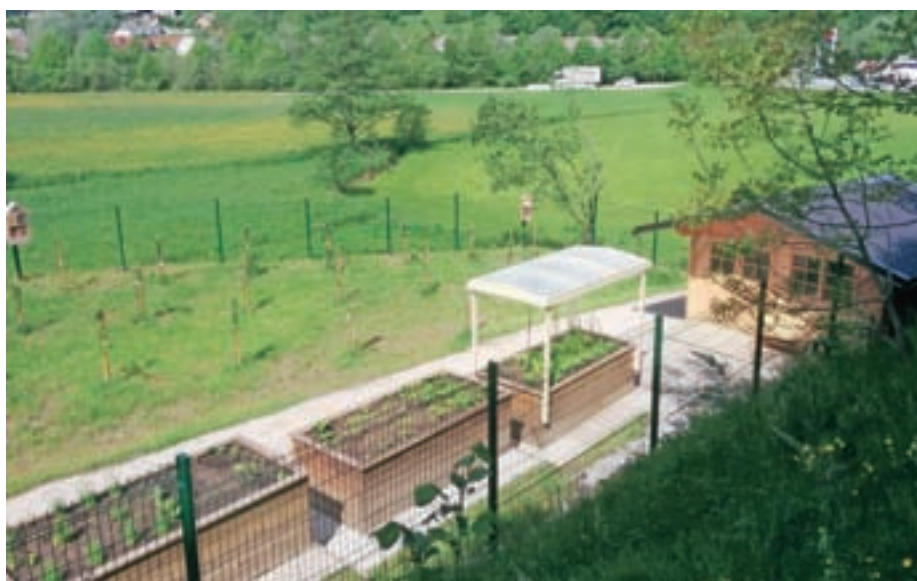
Šolski vrt, maj 2020

V šolskem letu 2019/20 smo postali v Žireh bogatejši še za eno pridobitev, za šolski vrt ali drugače rečeno, za učilnico v naravi, ki obsega različne učne vrtove, kot sta sadni in zelenjavni vrt ter nasad jagodičevja. S projektom se