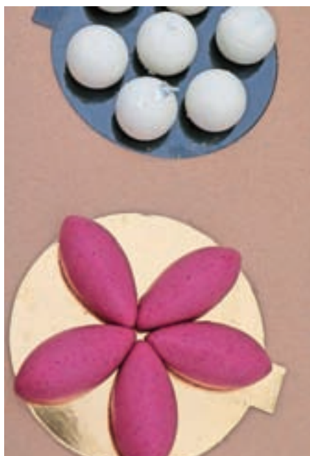
Porcijske sladice so ena izmed Darjinih bolj priljubljenih slaščic.