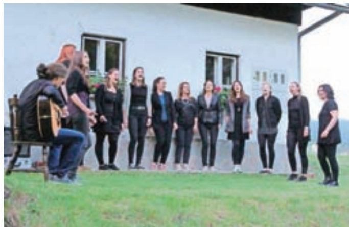
Dekliška vokalna skupina AddBeat