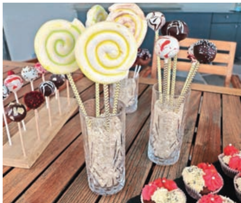
Vablivo, barvito in okusno: čokoladni mafini z jagodnim polnilom, lizike iz beljakove kreme, tortne lizike

Počasi tudi ugotavlja, pri ustvarjanju katerih sladkih dobrot resnično uživa. Najraje peče torte, se posveča porcijskim sladicam, malim grižljajem na palčki – kot so cake popsi ali tortice na palčki, tortne lizike; indijanci so ji tudi blizu, pa mafini, na primer. V vsem tem času je tudi ugotovila, da je včasih dovolj, da je le lepa in okusna tortica, pa osrečiš stranko ali gosta; da tudi tu lahko velja: manj je več.